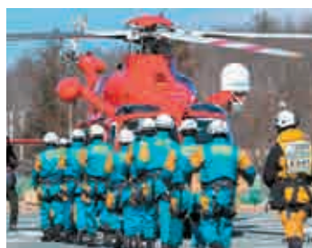
▲県警機動隊大規模災害対応訓練