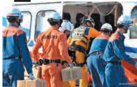
▲防災基地物資搬送訓練

防災航空隊は県内消防本部からの要請に基づいて出場します。災害発生時に円滑に対応できるように消防本部との連携訓練を実施しています。